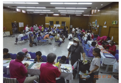
手作りおもちゃブース