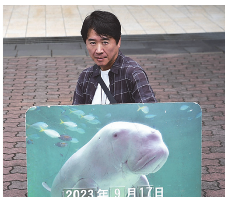
伊勢神宮参拝の折に立ち寄った鳥羽水族館にて

昨年は短期講座で「歌びと万葉集」を、今年は本科「～ドラマチックに学ぶ～古事記と万葉集科」を担当させていただいています。どちらも定員を上回る応募があり、熱気に満ちた教室で、わたしも自然と力が入ります。コーダイはわたしにとってパワーの充填場所。受講生に感謝しています。講義の中でも多くの神社を紹介していますが、時間があれば各地の神社をめぐるのが一番の楽しみでしょうか。