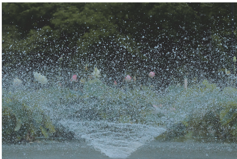
「蓮のカクテル」 南洋子

撮影会で行った鶴見緑地の咲くやこの花館で食事をした後、レストランの中から、ガラス越しに撮りました。