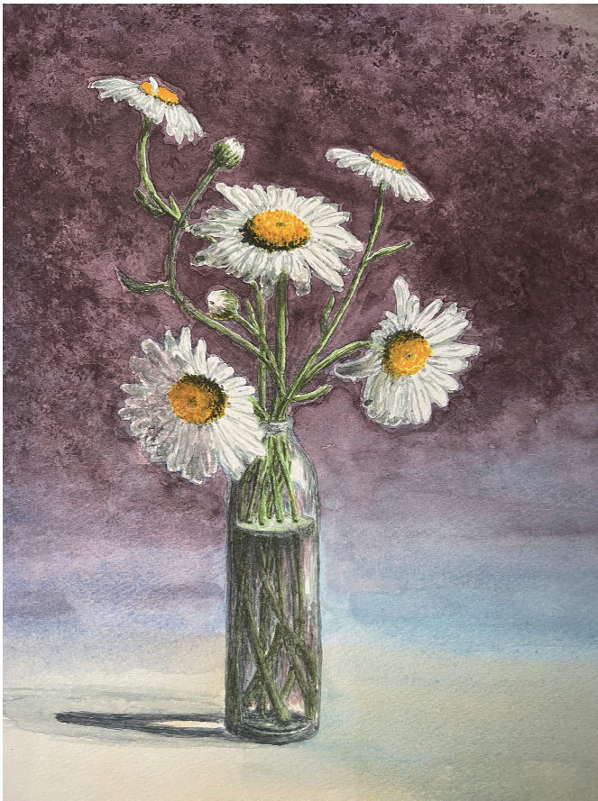
「夏白菊の花」 吉井 宏之

『身近な自然物とガラスや金属を組み合わせる』というテーマの授業で描いた習作です。ガラスの質感の表現に一番注意を払いました。主役の花が引き立つような背景の着彩に苦労しました。