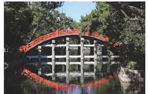
現代の「住吉反橋」 (2023年9月11日撮影)