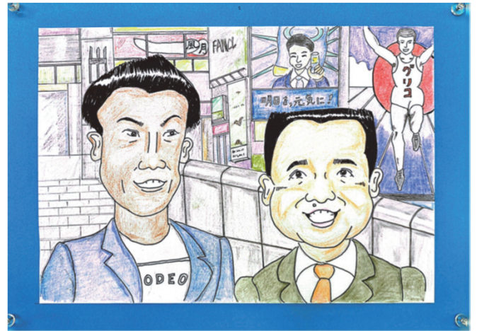
「漫才師 ミルクボーイ」 村上 恵三