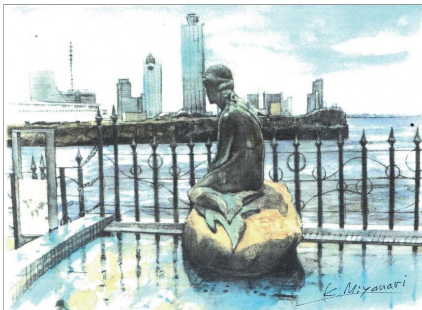
「南港のマーメイド」 宮成公広

コーダイスケッチで大阪南港に行きました。海遊館の先に素晴らしい風景“マーメイド”があり、感激して描きました。