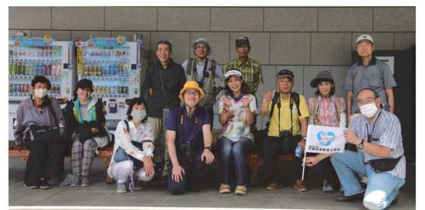
2023年8月10日 長居植物園にて撮影