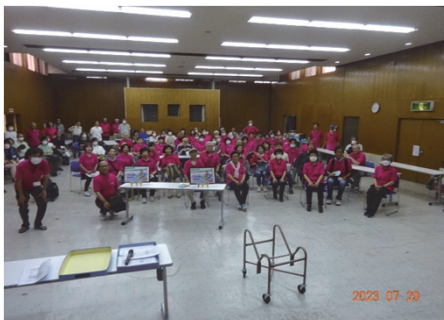
スタッフ全体写真