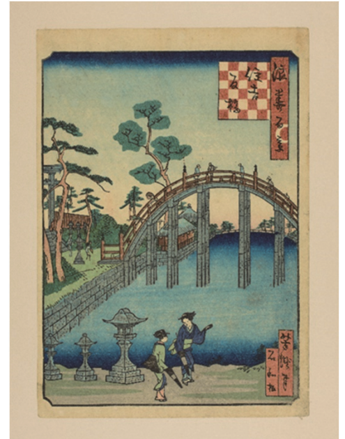
浪花百景「住吉反橋」里の家芳瀧 画 1800年代 大阪市立中央図書館蔵

江戸時代には、「海上安全の守護神」として崇められ、全国海運業者・問屋などから奉納された600余基の石灯籠が、その大きさを競い合うように境内に現存、今も当時の風情を醸し出しています。この「石灯籠群」と「住吉大社」は、2018年に北前船にゆかりのある構成文化財として『日本遺産』に追加登録されています。